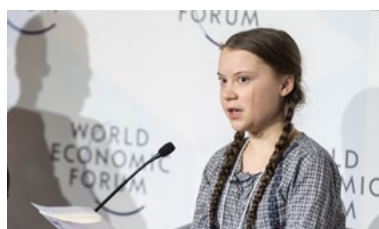
Greta Thunberg, svensk klimaaktivist

» Nogle mennesker er så desperate for at kunne fastholde deres livsstil og hverdagsluxus, at de formaner andre om ikke at sætte børn i verden. Vi, som endnu er børn, må på vegne af vore lillesøstre og lillebrødre tage afstand fra en så uninspirerende tilgang. Det er ikke vores generation eller fremtidige endnu ufødte, der har skabt klimatruslen. Men igen er det os, man vil have til at betale prisen. «