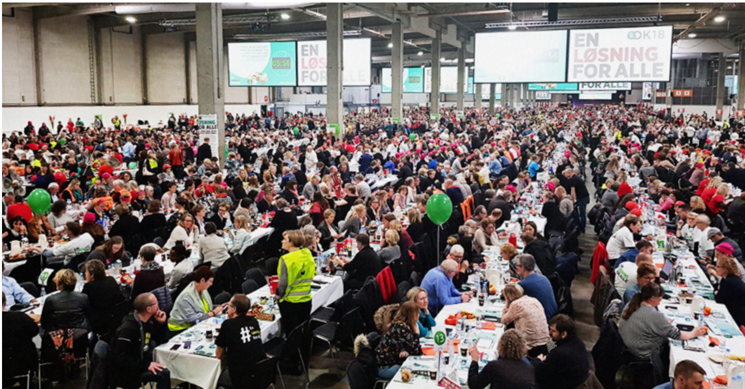
10.000 tillidsrepræsentanter samlet til stormøde i Fredericia.