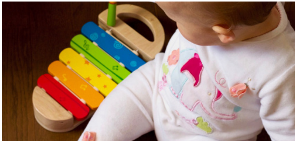
Deleøkonomiske centraler kan låne babytøj ud.