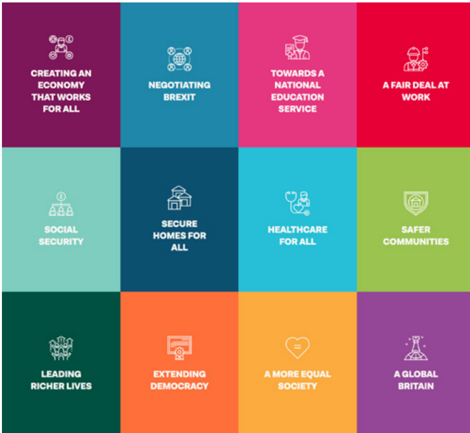
Illustrationer: Fra Labours manifest og hjemmeside