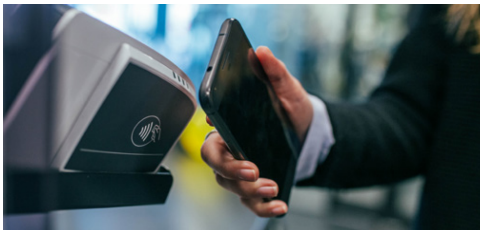
Grundlæggende bankfunktioner skal være gebyrfrie.