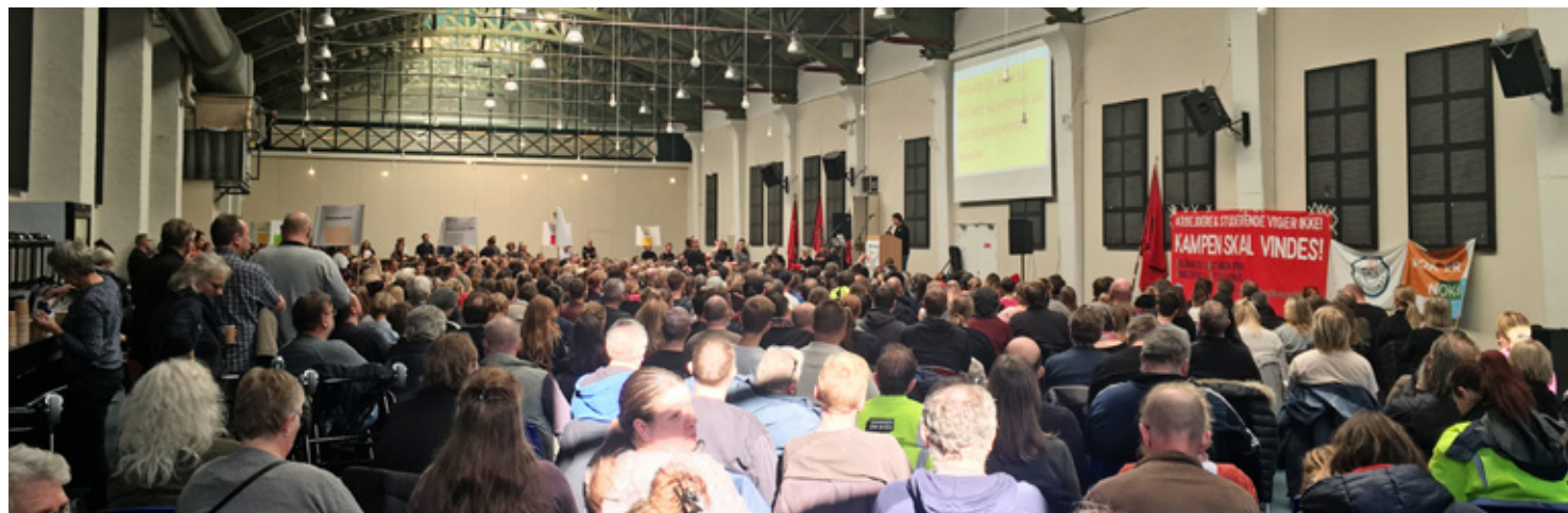
800 tillidsfolk fra hovedstadsområdet styrker sammenholdet og kampgejsten i Nørrebrohallen.

I bl.a. Svendborg, Furesø og Esbjerg har Enhedslisten stillet tilsvarende forslag, mens Enhedslisten i Odder har foreslået, at de besparelser, en eventuel lockout giver, skal komme de berørte områder til gavn. F.eks. skal al sparet løn på lærerområdet gå til forbedringer på skoleområdet.