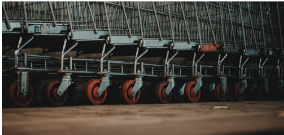
Dansk Supermarked og COOP sparer ansatte ved at bruge praktikanter.