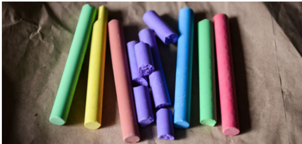
Fat kridtet for læringens skyld – ikke karakterens.