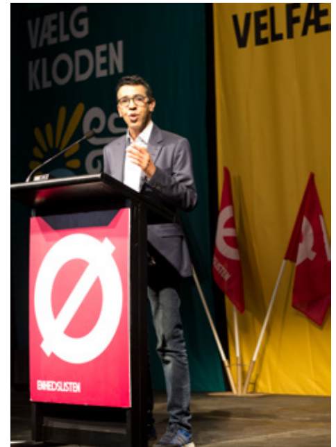
En masse internationale gæster besøgte årsmødet. En af dem var Younous Omarjee, der er medlem af EU-parlamentet for La France Insoumise.