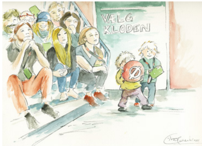
Der blev argumenteret, lyttet - og leget flittigt på Enhedslistens 30. årsmøde.