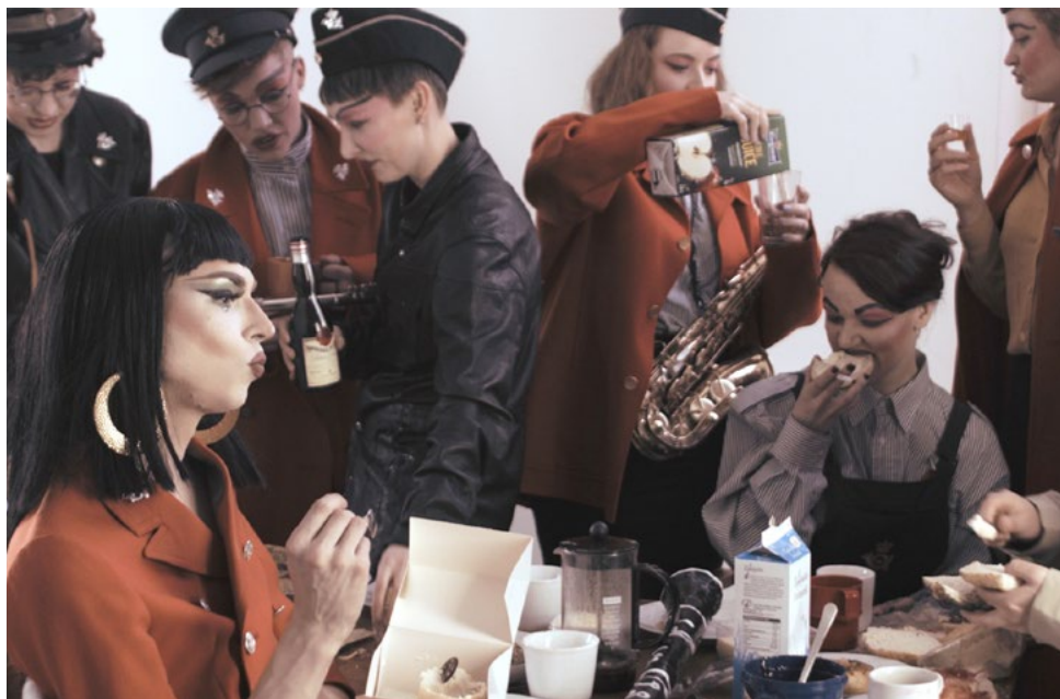
Kirsten Astrup, Troe og Agtsom, 2017. Courtesy kunstneren. Foto: Tore Hallas