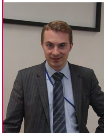
Morten Messerschmidt i sin grundlovstale i Frederikssund efter tilbagevenden fra sygeorlov.

»Men man må regne sig som en del af Danmark for at være Danmark. Må føle det. Man må lære sprog og føle fædrelandet for at være en del af fællesskabet.«