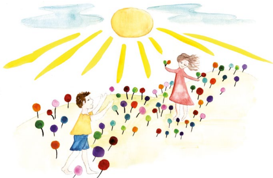
Illustration: Cathrine Gram, fra bogen 'Viggo og Walthers verden', Udgivet af Landsindsatsen EN AF OS

Væk med tavshed, tvivl og tabu om psykisk sygdom!