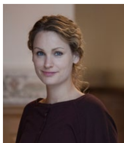
Pernille Skipper sagt i anledningen af 75-året for Auschwitz' befrielse

» At være vred på skiftende israelske regeringers forfærdelige handlinger er berettiget. Det er ALDRIG berettiget at lade det føre til antisemitisme. Og som nogle af de fremmeste forkæmpere for palæstinenserne rettigheder skal venstrefløjens også være de fremmeste forsvarende af jøder her i Danmark og i resten af verden.«